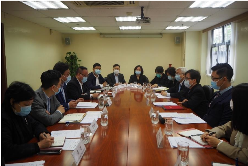
藥物監督管理局與深合區商事服務局及經濟發展局就藥物監管工作進行交流

內地申請中成藥註冊相關的諮詢服務，以及表達了中藥提取物從內地出口到澳門所遇到通關的困難。為此，藥物監督管理局在與深合區商事服務局及經濟發展局的會議中也一併提出中藥提取物進口澳門時遇到的問題，一同探討解決方案。藥物監督管理局將透過定期與業界進行會面溝通，以了解業界的發展情況並協助解決業界所遇到的實際問題，支持產業發展。